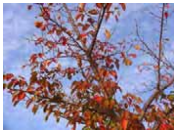
青い空に映えるさくらの紅葉

落葉植物に見られる、葉が落ちる前の色の変化のことを紅葉と呼んでいます。冷え込みを感じてくると、葉のつけねに仕切りができて（離層）、水や養分を通す管が閉じられます。これから色の変化が始まります。