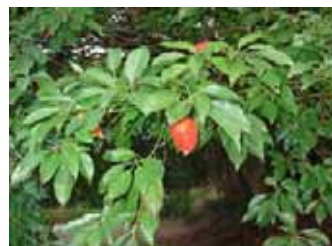
コバンモチ ホルトノキ科 常緑高木