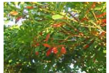
ホルトノキ ホルトノキ科 常緑高木