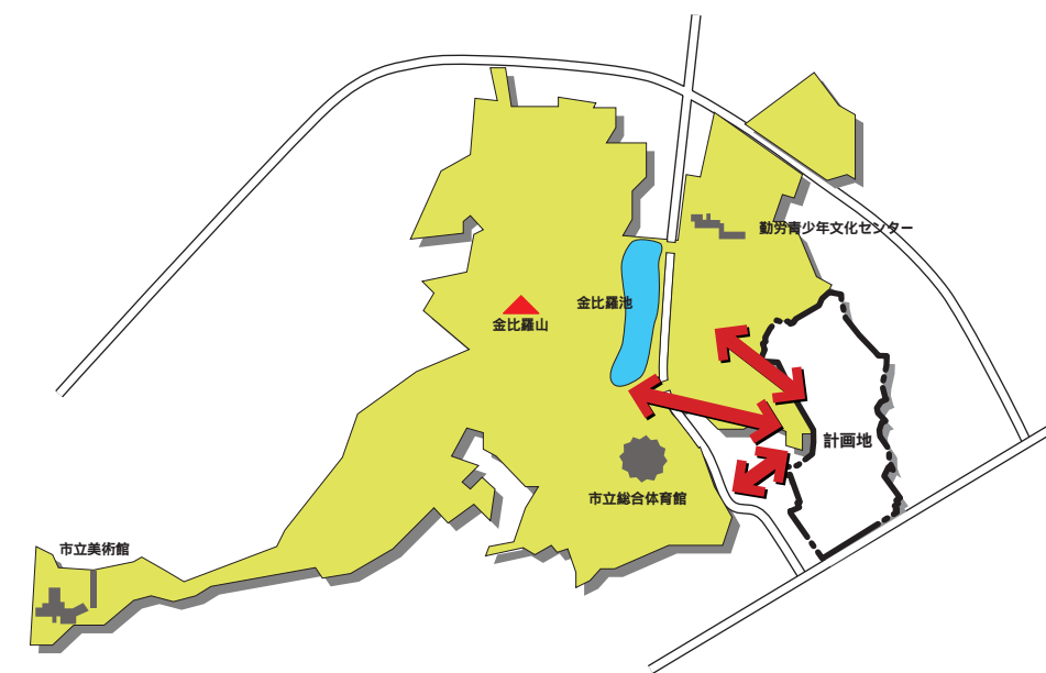
中央公園の自然を積極的に活用し、身近な自然を体感するための「窓口」となる